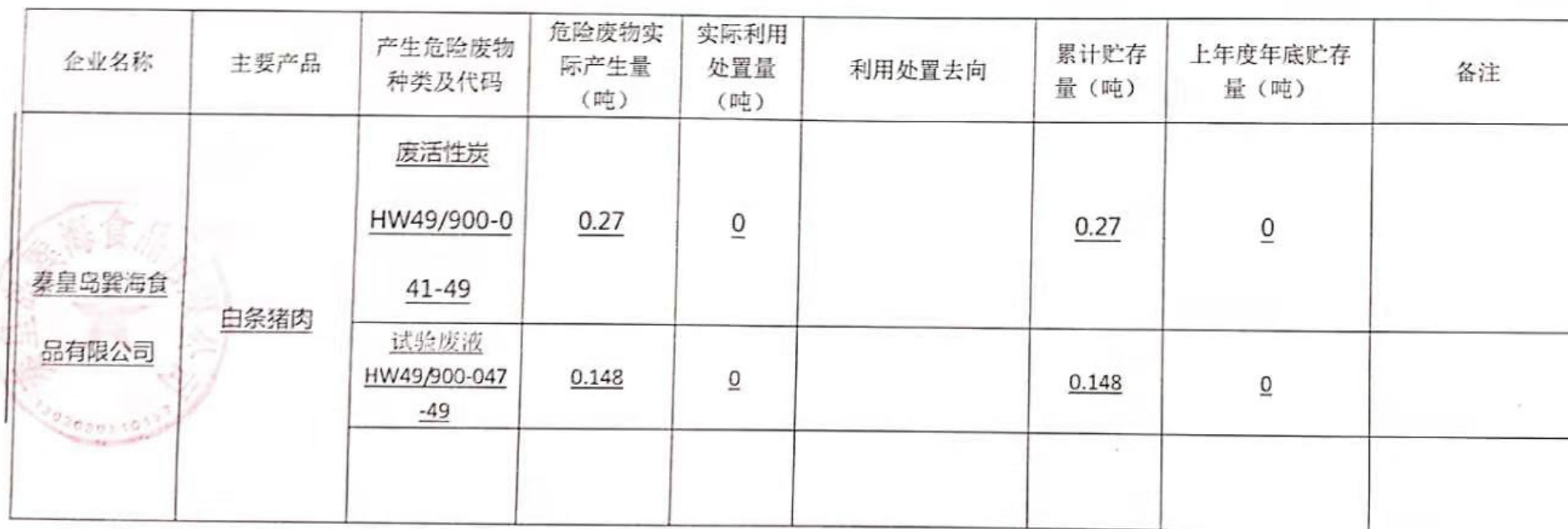
秦皇岛市危险废物产生单位信息公开模板（2020年1-12月）

注：1. 可依据企业实际生产情况、工艺特点适当调整表格或增加文字描述。 2. 需要加盖企业公章。